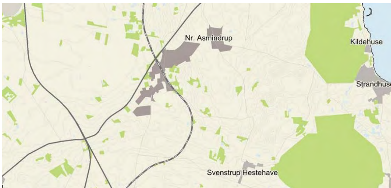
Nr. Asmindrup og omegn

Nr. Asmindrup består oprindeligt af de to landsbyer, Nr. Asmindrup og Svininge, der med tiden næsten er vokset sammen. Da Odsherredsbanen blev anlagt, blev stationen bygget i Svininge. Da der allerede fandtes en langt større stationsby ved navn Svininge (el. Svininge Stationsby) ca. 25 km sydligere på Odsherredsbanen, fik stationen navnet Nørre Asmindrup og det nybyggede område omkring stationen blev til Nørre Asmindrup Stationsby. De to byer er dog fysisk adskilte, men vil i rammerne blive beskrevet som en helhed.