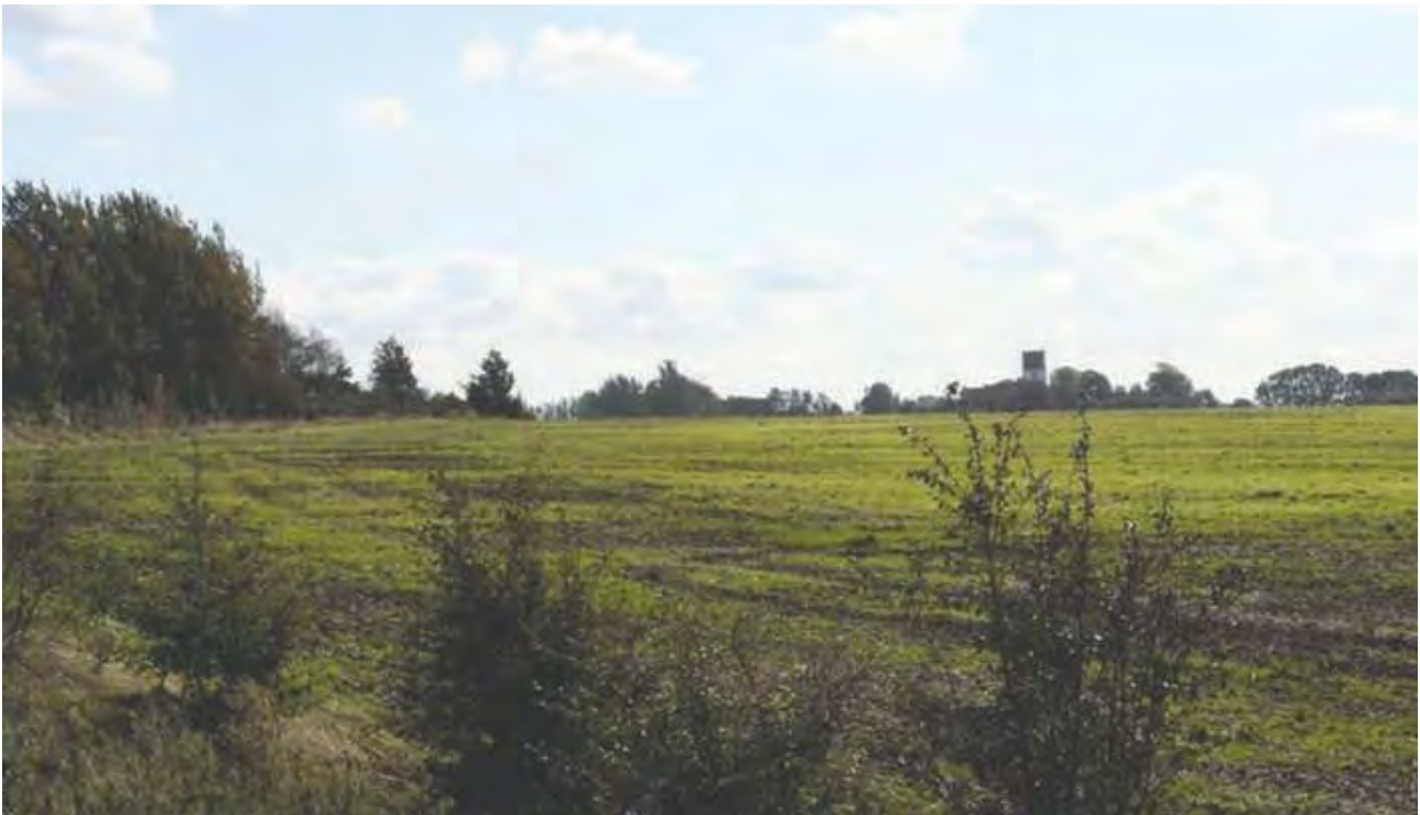
Landskabet omkring Nr. Asmindrup med udsigt til Nr. Asmindrup Kirke