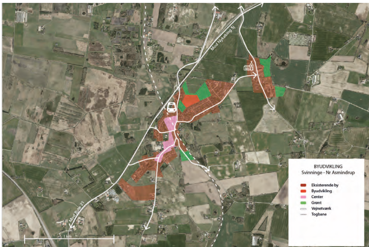
Bystruktur Svininge - Nr. Asmindrup

Nr. Asmindrup består oprindeligt af de to landsbyer, Nr. Asmindrup og Svininge, der med tiden næsten er vokset sammen. Da Odsherredsbanen blev anlagt, blev stationen bygget i Svininge. Da der allerede fandtes en langt større stationsby ved navn Svininge (el. Svininge Stationsby) ca. 25 km sydligere på Odsherredsbanen, fik stationen navnet Nørre Asmindrup og det nybyggede område omkring stationen blev til Nørre Asmindrup Stationsby. De to byer er dog fysisk adskilte, men vil i rammerne blive beskrevet som en helhed.