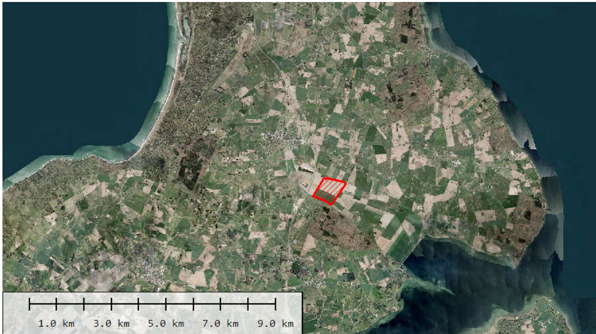
Figur 1: 60 ha solcellepark indsat i Sidinge Fjord.

Et stort problem med solcelleparker og vindmølleparker er, at kun få ønsker at være naboer til en. De er OK, bare de ligger i den anden ende af kommunen, i Jylland eller til søs.