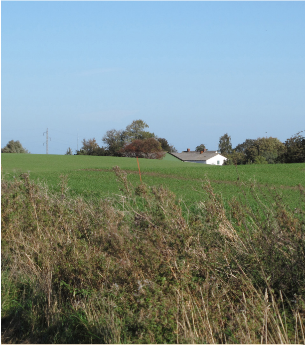
Landbrugsbygning gemt i det åbne land.