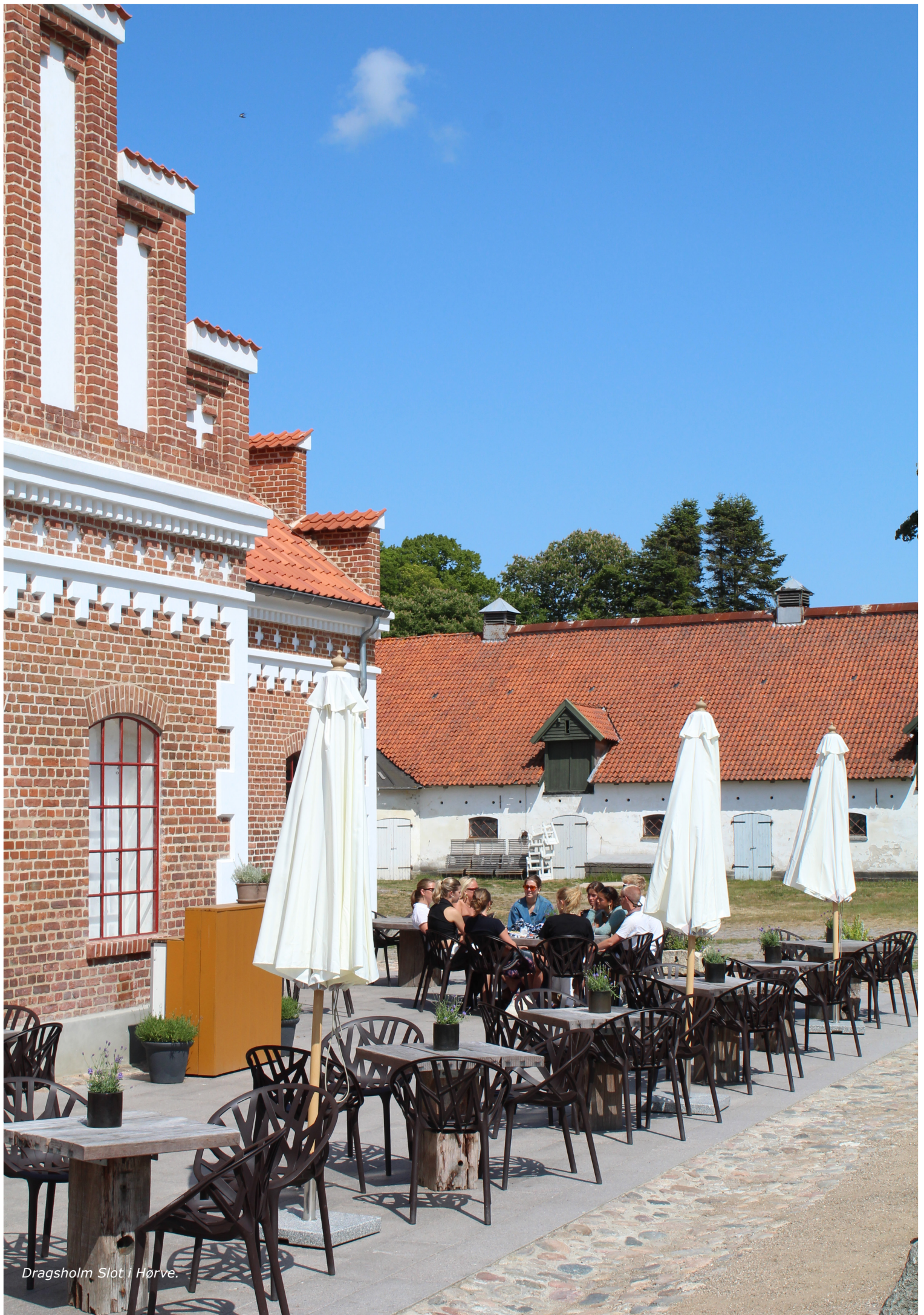
Dragsholm Slot i Hørve.