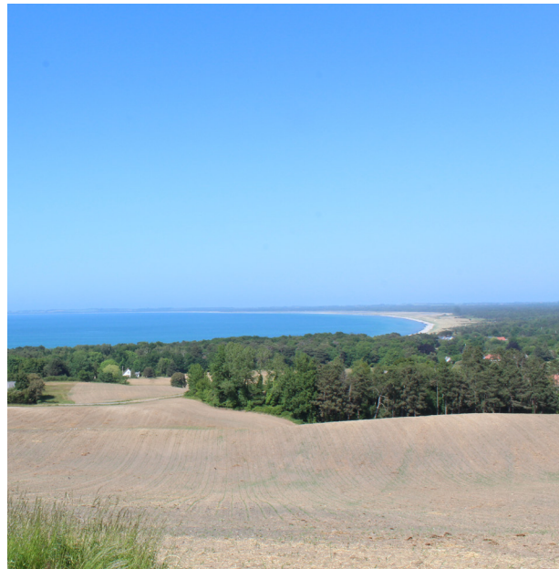
Udsigten over Sejrøbugten fra Veddingevej.

I dette kapitel sætter vi fokus på Odsherreds landskab og miljø. Først og fremmest har vi fokus på genbrug og cirkularitet i byggeriet. Vi sætter fokus på, hvordan vi skaber arkitektur, som spiller sammen med landskabet, og hvordan vi skal sikre bebyggelse af god arkitektonisk kvalitet i det åbne land og i sommerhusområderne.