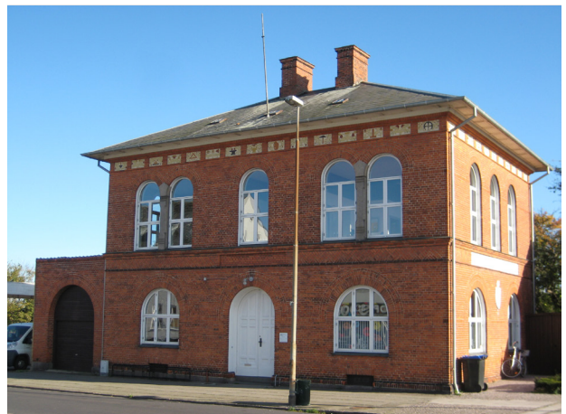
Den Tekniske Skole i Nykøbing anno 2023, en del af Odsherreds kulturarv.