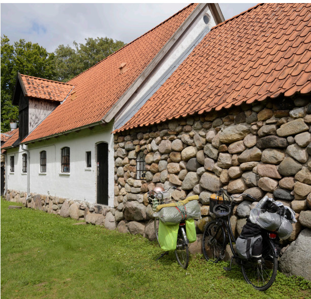
Det skal være nemmere at cykle og gå en tur i stedet for at tage bilen.

Derfor skal trafikken tænkes anderledes, fx med ensretninger af nogle gader, flere bilfrie gader. Det kan være en mulighed at se på midlertidige parkeringspladser – for eksempel i sommersæsonen, hvor mange turister gerne vil køre ture i Odsherred, eller på om der kan laves grønnere parkeringspladser, som bliver forskønnet af træer og en belægning, der giver plads til naturen.