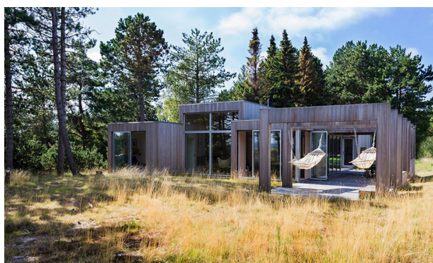
Sommerhus i Rørvig, tegnet af Lotte Elkiær.