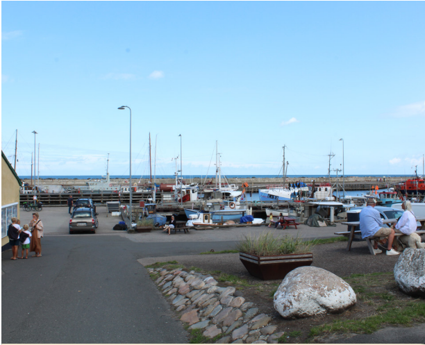
Mange muligheder for at sætte sig på en bænk på Odden havn, gør det muligt for forskellige mennesker at samles.