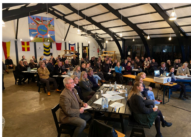
Inspirationsmøde og workshop for arkitekturpolitik i 2023 på Sjællands Odde, præsentation af Jan Gehl.