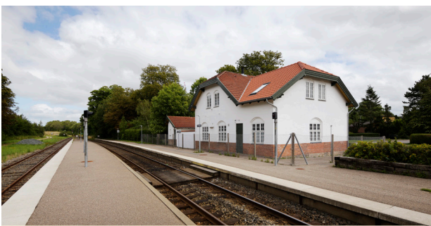
Nationalromantisk stationsbygning i Grevinge fra 1899. En stor del af Odsherredsbanernes bygninger var tegnet af DSB's overarkitekt Heinrich Wenck ligesom stationerne i hovedstaden.