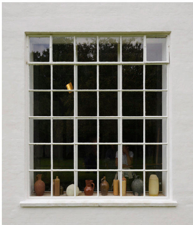
Et vindue i Museum Malergården i Plejerup, som har bevaringsværdi 2.