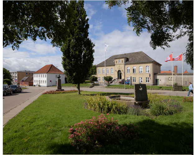
Det gamle bymidte i Nykøbing har ikke mange opholdsmuligheder.

Det er vigtigt at give folk noget 'at komme efter', da mennesker tiltrækker mennesker. Udgangspunktet for at skabe et levende byrum er derfor at give det funktioner, som tiltrækker.