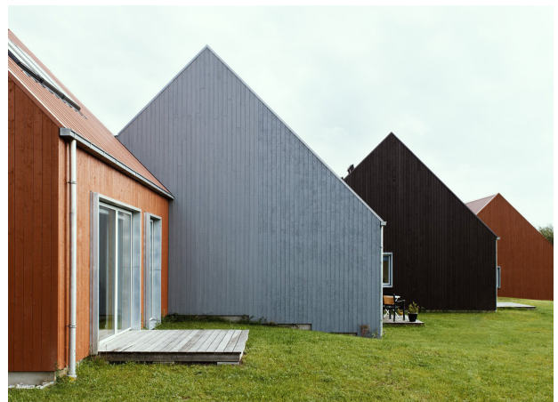
Nogle gange kan små og simple greb, skabe en mere blandet oplevelse af et boligområde. I andelssamfundet Hjortshøj, har man lavet et simpelt farveskift på de enkelte boliger, for at skabe større genkendelighed i arkitekturen.

Blandede byer fremmer social mobilitet, hvilket i fremtiden kan øge velstanden i samfundet 9