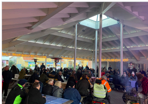
Torvehallen på hovedgaden i Vig er skabt af borgerne selv.

Det vil Odsherred Kommune arbejde med igennem forskellige indsatser. Det starter selvfølgelig her med arkitekturpolitikken. Derudover vil Odsherred Kommune forbedre formidlingen af arkitekturens betydning, når der arbejdes med udviklingsprojekter, kommuneplan og lokalplaner – og skabe en forståelse for, hvor vigtigt det er at deltage i den offentlige proces. Indsatserne er beskrevet yderligere i handleplanen til arkitekturpolitikken.