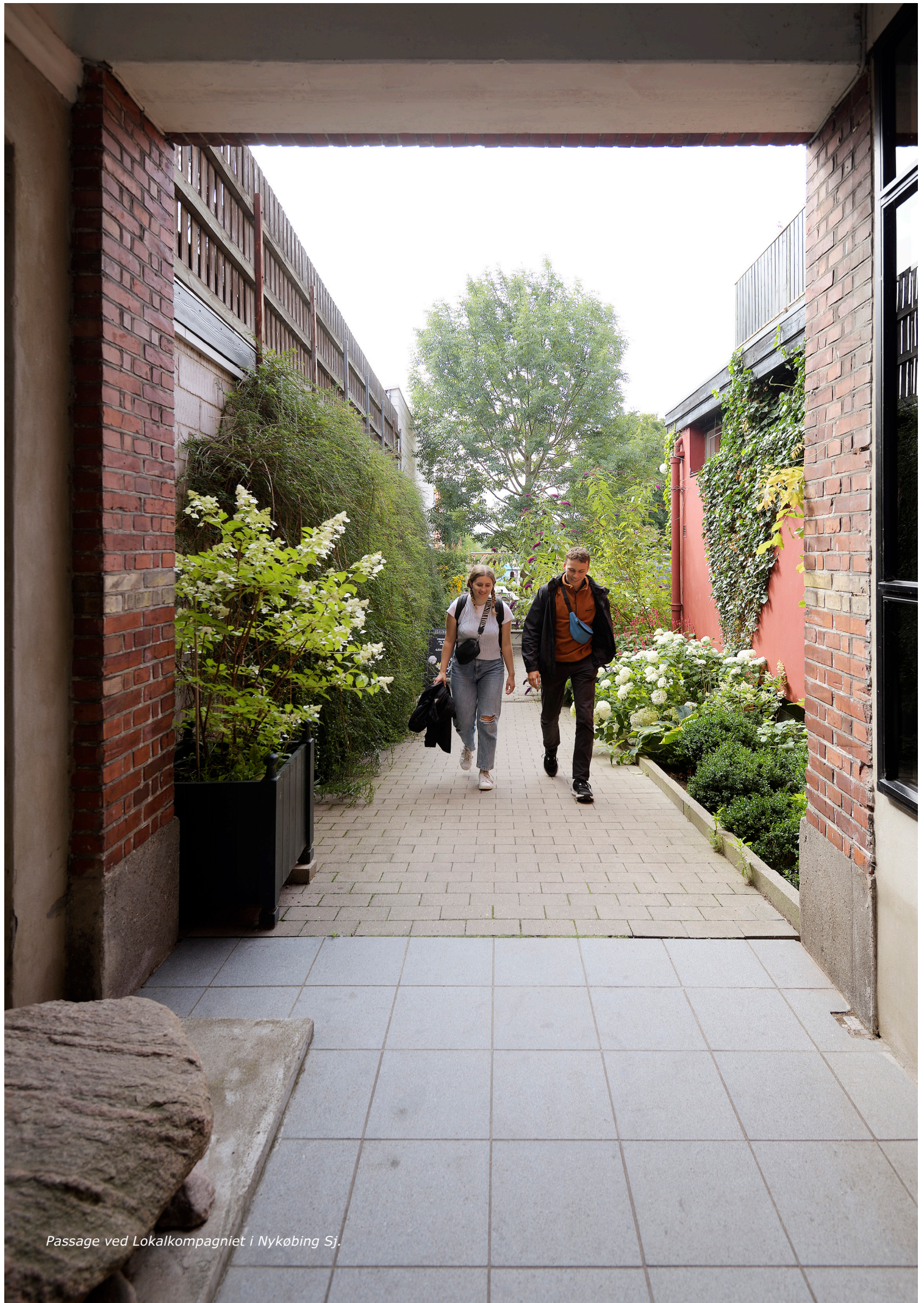
Passage ved Lokalkompagniet i Nykøbing Sj.