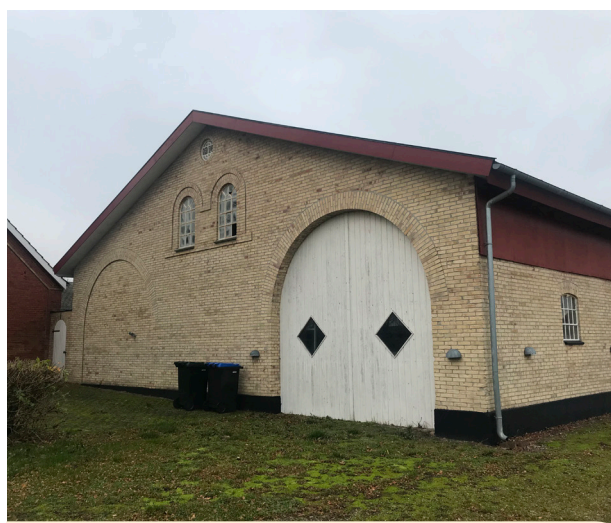
På Stålhøjvej i Asnæs har bygherren besluttet at beholde den gamle gård fra 1900-1923 og lave den om til 17 moderne lejligheder. Det betyder, at vi både sparer på jordens ressourcer, men også at områdets kulturhistorie bliver bevaret.