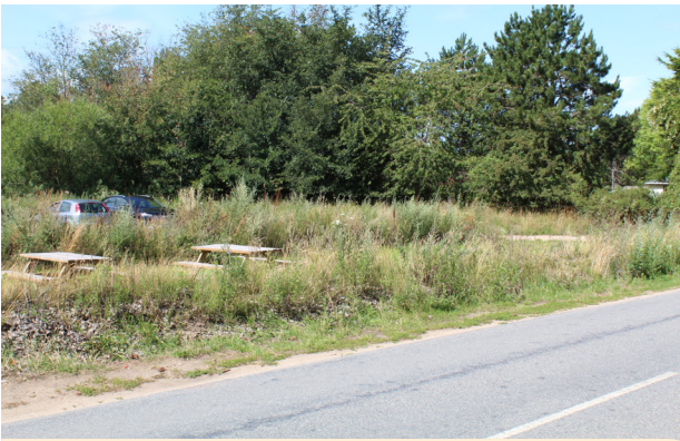
Eksempler på parkeringspladser, som er gemt her hos Tir bageri på Gniben, Sjællands Odde.

Biler og parkeringspladser fylder meget i Odsherred. Det er helt naturligt, og det er vigtigt, at alle kan transportere sig til de større byer og til aktiviteter både i og uden for kommunen. Samtidig er der et stort ønske fra både beboere og fritidsborgere, at biler og parkering fylder mindre i gadebilledet.