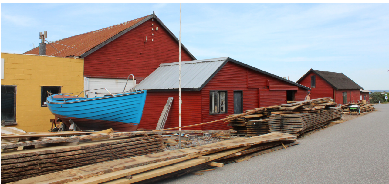
Bådværft på Odden havn, som har en særlig identitet med sine små fiskehytter og træværkstedet.