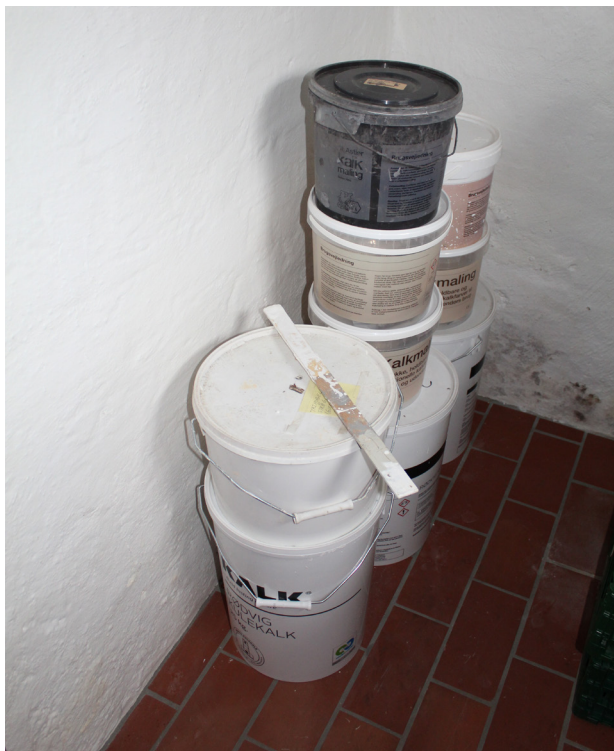
Forskellige materialer som bliver brugt til at vedligeholde et hus i Vallekilde fra før 1960. De er allesammen baseret på kalk.

Målsætning: At tilstræbe at istandsætte og renovere gamle bygninger med de materialer som bygningen er født med