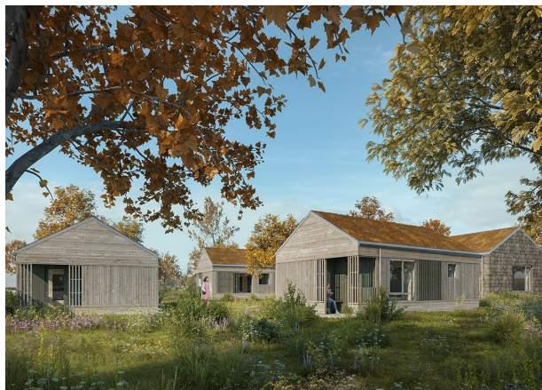
Visualiseringer af nye tiny-houses ved Egedal behandlingssted for psykisk syge unge i Hørve af Tegnestuen Stedse.

Mange undersøgelser viser, at sanseligheden af vores byggede miljø har en stor virkning på os mennesker 10 . For eksempel øges arbejdsglæden på arbejdspladser med mere naturligt lys, og patienter, som har udsigt til grønne arealer, bliver hurtigere udskrevet end patienter, som ikke har 11 .