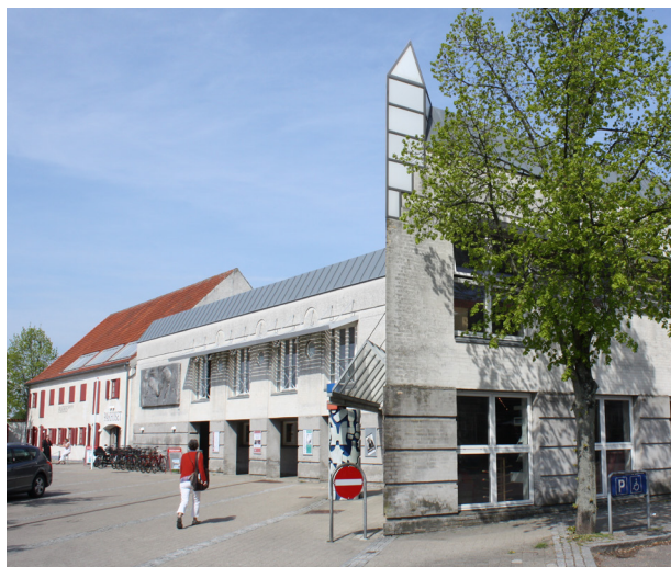
Biblioteket i Nykøbing fra 1989 er i klar kontrast til den historiske bygning ved siden af. Tegnet af arkitektfirmaet Dissing og Weitling.

Målsætning: At lægge vægt på en helhedsvirkning med omgivende gademiljøer og landsbymiljøer og respektere steders særlige identitet