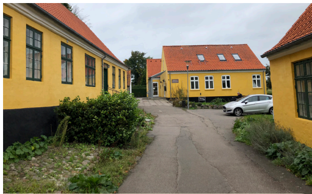
Det nyere hus i Nykøbings gamle bymidte (i baggrunden) er tilpasset områdets særlige identitet.

Målsætning: Nybyggeri skal forholde sig til steders særlige identitet og respektere historiske miljøer