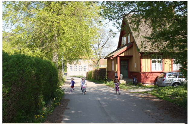
Kulturmiljø i Vallekilde, med mange bevaringsværdige bygninger og smukke gamle træer.

For at bevare den historiske fortælling i et område, som også er med til at skabe stædernes særlige identitet, skal nybyggeri respektere de historiske miljøer og tilstræbe at indpasse sig til området. Det betyder ikke, at det skal være en kopi af den eksisterende bebyggelse, det kan også være en detalje, farve eller form, som tages med i den nye bebyggelse.