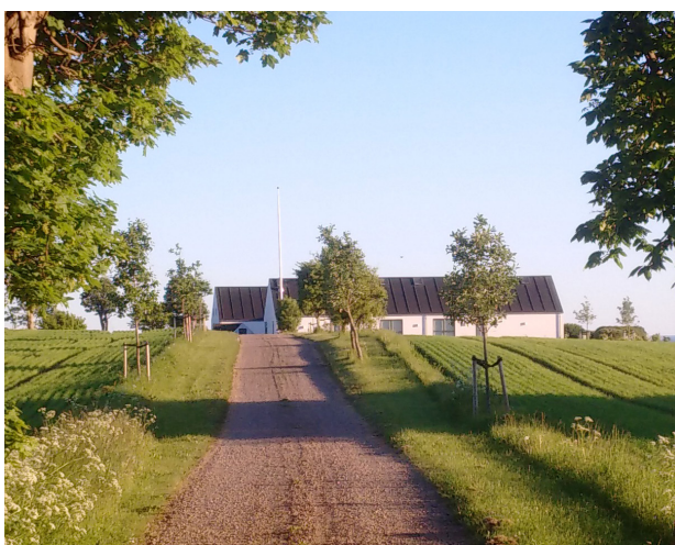
Hus på Sjællands Odde fra 2011, har i den hvide farvesætning og strukturen som trelænget gård, refereret til Odsherreds kulturhistorie, men er samtidig et helt moderne hus.