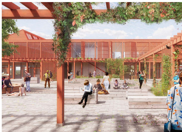
Visualisering af den nye campus Odsherred i Asnæs af tegnestuen Vandkunsten.

Overflader og materialer påvirker vores ubevidste og bevidste forståelse af det byggede miljø. Derfor er det vigtigt at tænke på sanseligheden og detaljerne i arkitekturen, og at materialer og bygningens funktioner er lette af aflæse, så vi, som mennesker, kan forstå og være trygge i de byrum, vi er i.