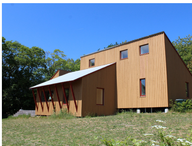
Dette hus er tilpasset omgivelserne i Vallekilde ved at bruge de samme materialer og farver, som forskellige bygninger i området, blandt andet øvelseshuset på billedet til venstre. Arkitekt Arcgency, opført i 2020.