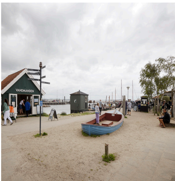
På Rørvig havn er der forskellige aktiviteter og funktioner som tiltrækker mange forskellige mennesker.