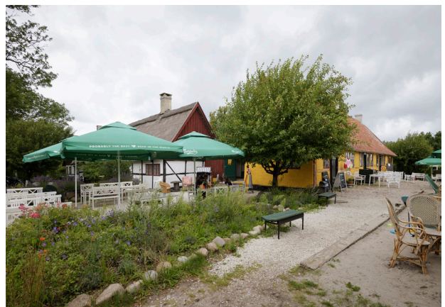
Lodsoldermandsgaarden i Rørvig 1681 er del af den gamle landbys kulturmiljø, som markerer sig med krumme gader og stræder og mange gamle bygninger, hvoraf nogle er flere hundrede år gamle.