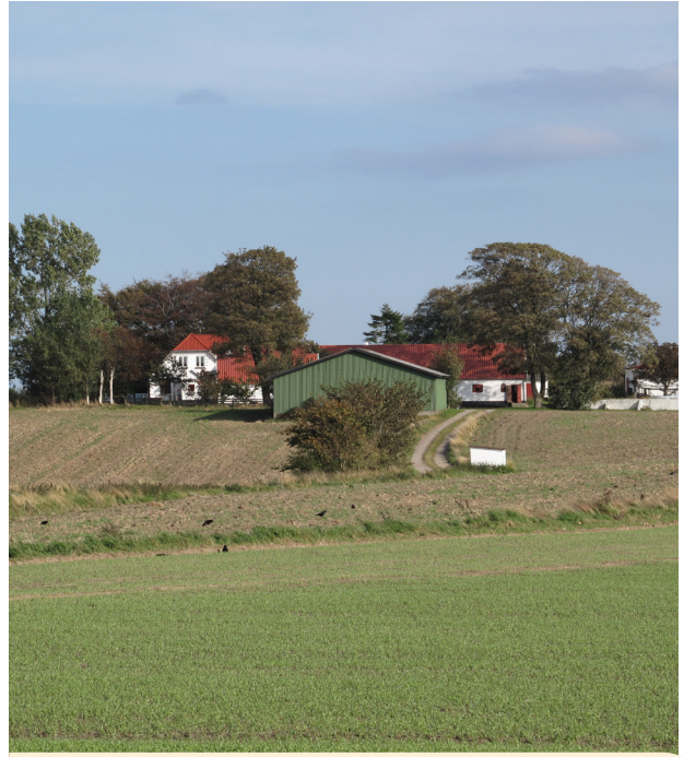
Landbrugsbygning placeret på tværs af vejen, så den fylder mindre i landskabet.