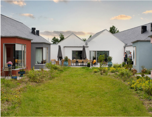
56 plejeboliger og 26 seniorboliger i Himmelev ved Roskilde. Tegnet af RUBOW arkitekter.