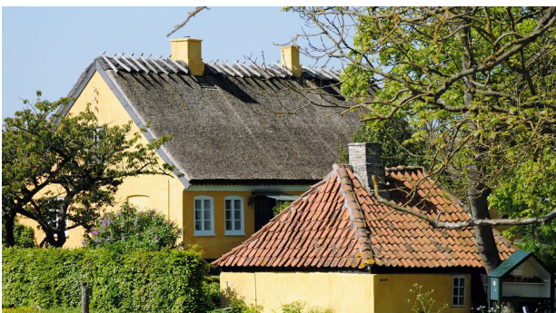
Stråttækt længehus fra 1800 og den gamle smedje i Nakke landsby.