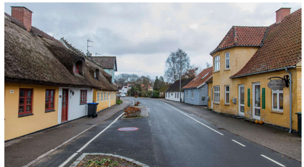
Slynget landsbygade i Højby med gamle gård- og længehuse samt nyere villaer, som er tilpasset landskabet