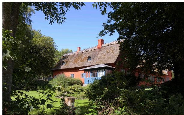
Den røde gård i Vindekilde, som er fredet, er opført med de materialer som var tilgængelige som strå, kalk, ler og træ.

Vi skal værne om den historiske fortælling i vores byggede miljø ved at sikre gamle huse mod nedrivning og udslettelse.