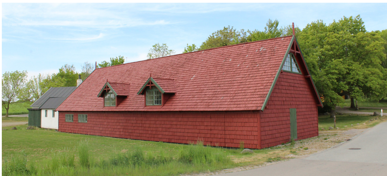
Øvelses- og forsamlingshus fra 1880 i Stenstrup, opført i nationalromantisk stil og beklædt med træspån, tegnet af Andreas Bentsen.

Dette kapitel sætter fokus på Odsherreds kulturarv, og den måde vi kan skabe opmærksomhed på det gennem registrering af bevaringsværdier og kulturmiljøer. Vi fokuserer også på steders identitet og vigtigheden af at tilpasse arkitekturen til dens omgivelserne. Til sidst er der et afsnit om vedligeholdelse af ældre bygninger, fordi det er de bygninger, som er med til at skabe Odsherreds identitet.