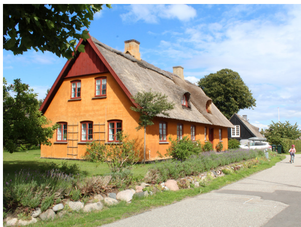
Huset i den gamle bymidte i Rørvig står kalke, hvilket giver det et levende udtryk og gør at huset kan ånde.