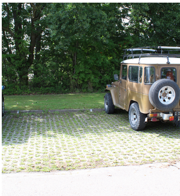
Rådhuset i Højby har permeable belægning på parkeringspladsen, som gør det nemmere for vandet at sive ned og samtidig gør området mere grønt.