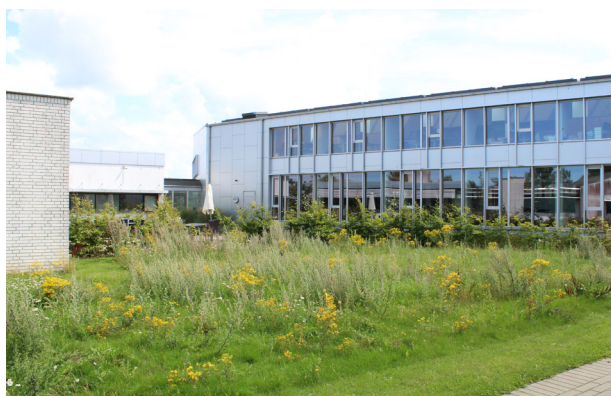
I rådhusets gårdrum klippes kun kanterne af pladsen, hvorefter planterne og blomsterne er kommet op.