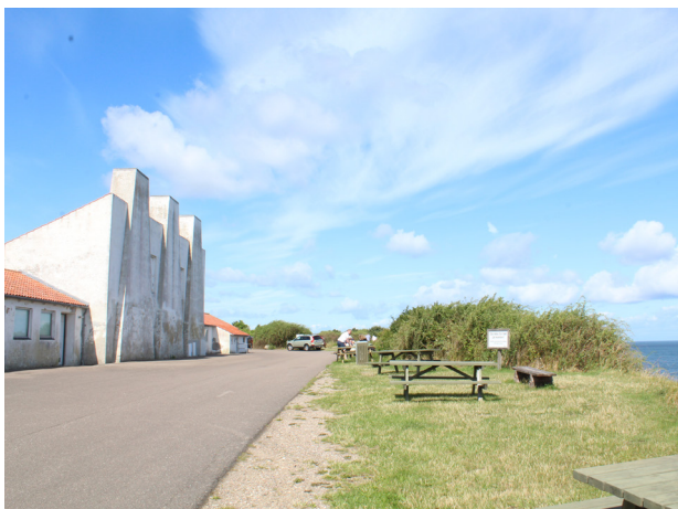
Røgeriet i Havnebyen, tegnet af Arne Jacobsen, er hverken fredet eller SAVE-registeret.

SAVE-registreringer er, sammen med bevarende lokalplaner, de værktøjer, som kommunen kan bruge for at sikre at bygninger bliver bevaret og renoveret med respekt for den arkitektoniske historie. Derfor vil vi arbejde målrettet mod at få registreret bevaringsværdige bygninger, så vi sammen kan passe på vores historie og identitet.