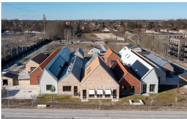
En cirkulær bygning, bygget med materialer fra en nedrivning på samme sted. Bygherre Gladsaxe Kommune.