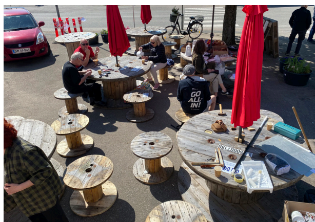
I områdefornyelsesprojektet i Asnæs spiller borgerinddragelse en stor rolle.