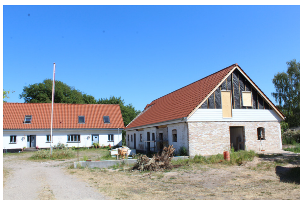
De gamle mursten bliver brugt til at bygge et nyt byggeri på samme sted i Veddinge.