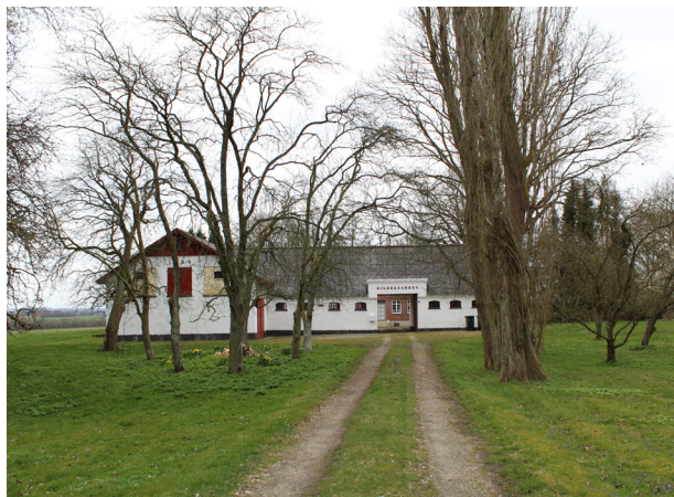
Eksempel på hvidkalket mur med rødmalet træ. Landbrugsbygning i Vallekilde fra 1850.