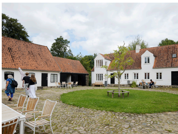
Gårdrum i Museum Malergården i Plejerup.