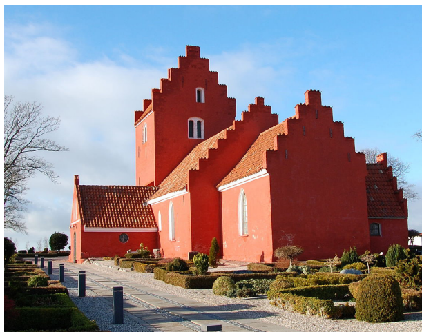
Den røde kirke på Sjællands Odde fra omkring 1300 fremstår stadig smukt med en kalket overflade,