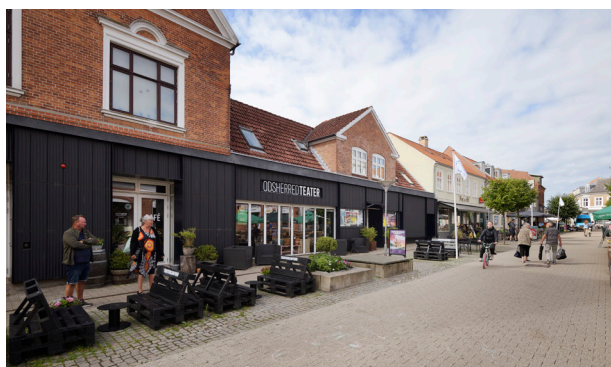
Odsherred Teater fra 2021 er i klar kontrast til den historiske bygning på Algade. Arkitekter Christensen & Co, Primus Arkitekter og STED.