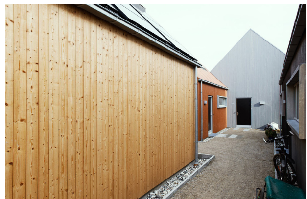
Andelssamfundet Hjortshøj i Aarhus med både ejer-, leje- og andelsboliger. Den første boliggruppe blev bygget i 1992. Der bor nu 300 mennesker i 8 forskellige bogrupper.