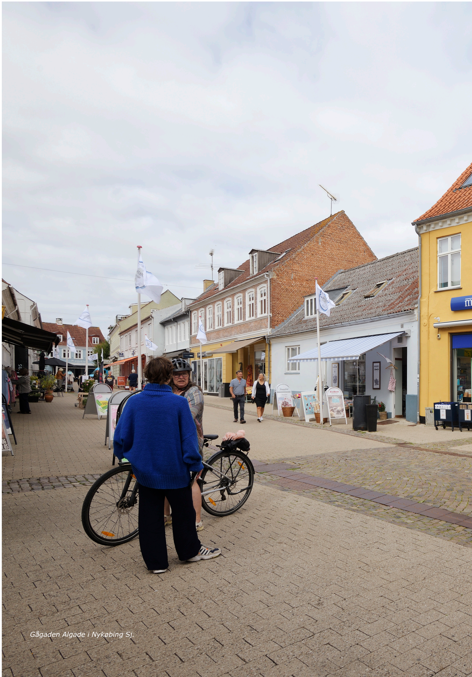
Gågaden Algade i Nykøbing Sj.