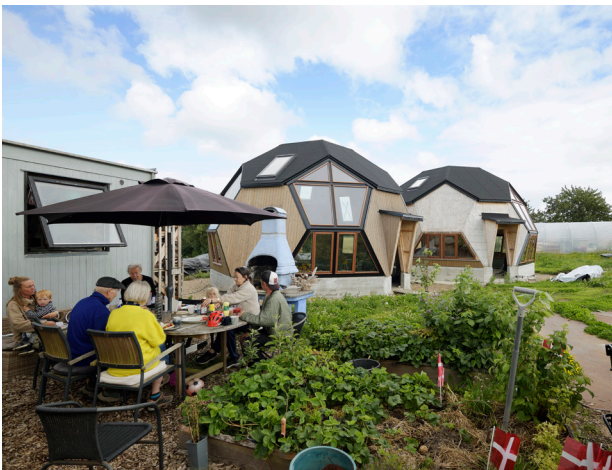
Familien spiser frokost ved siden af deres nybyggede domer i Egeskoven byggefællesskab.

Det betyder blandt andet, at der skal kigges på om fortovene er gode nok, belægninger er lette at gå på, at der er bænke og toiletter nok, samt steder hvor man kan mødes med andre mennesker. Det er vigtigt at være en del af bylivet – hele livet. Derfor er det også vigtigt at der er nok boliger som er egnede til ældre, og at de er placeret klogt – tæt på indkøb, apotek, læge, bus og tog – så man kan komme rundt at nå det hele på en let og tilgængelig måde.