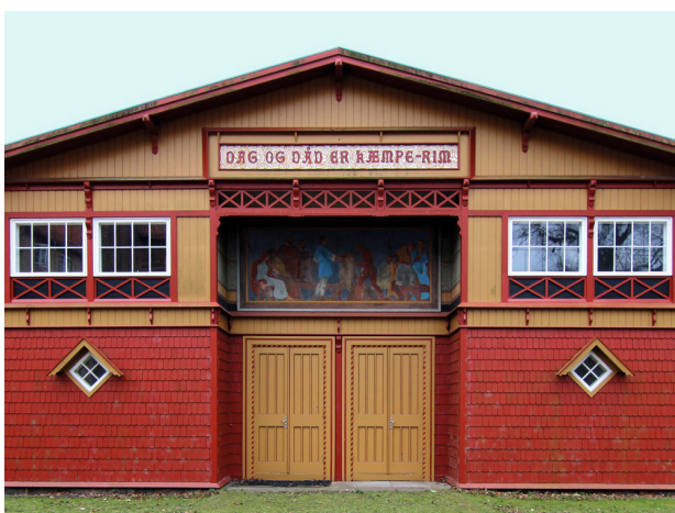
Martin Nyrops øvelseshus i Vallekilde fra 1884. Huset er forsynet med dekorationer og ornamentik - muligvis hentet fra vikingerne, for at slå på forbindelsen til den oldnordiske fortid.