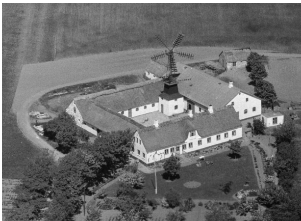
Firelænget gård på Sjællands Odde opført i 1874. Luftfoto fra 1948.

Du kan bestille tid til et telefonopkald på odsherred.dk/bestiltid