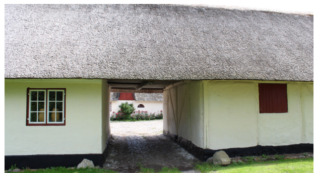
Eksempel på et "ods bindingsværk" - Opført med de materialer som var tilgængelige, som strå, kalk, ler og træ