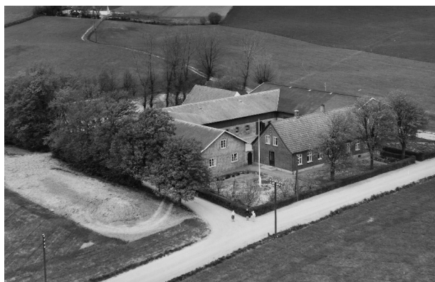
Stålhøjvej i Asnæs bygget omkring 1900, foto ca. 1953.

Målsætning: At fremme brug af materialer, der patinerer smukt og kan genbruges og genanvendes