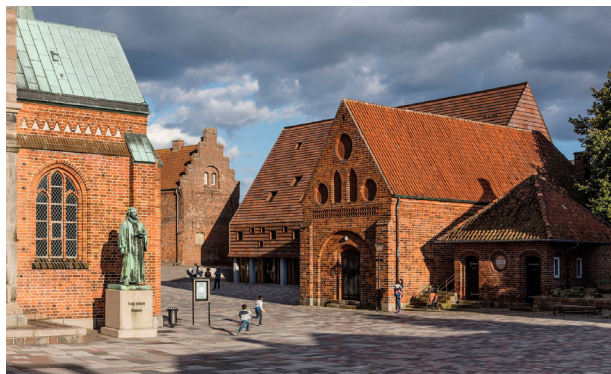
Den nyere bygning tegnet af Tranberg arkitekter er tilpasset Ribes gamle bymidte gennem blandt andet proportioner, materialer og farver.

Er du i tvivl om hvad der gælder for din ejendom, kan du altid booke en tid til et telefonopkald på odsherred.dk/bestiltid