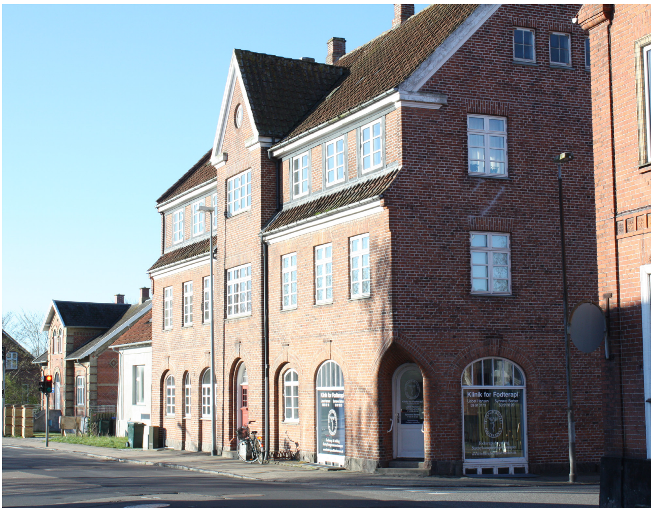
3,5 etagers byvilla tæt på stationen i Nykøbing, tegnet i 1916 af Einar Andersen. Husene ved siden af er revet ned, for at gøre plads til parkeringspladser og et supermarked i ét plan.

Mørke overflader absorberer solens stråler (lav albedo).