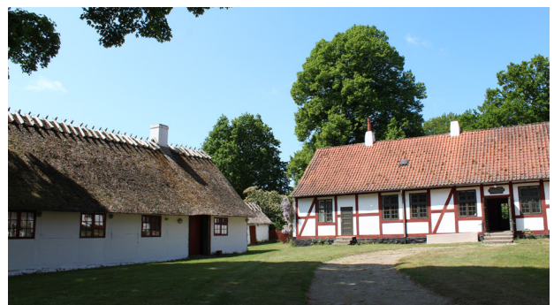
Præstegård i Egebjerg fra 1776. "Ods" bindingsværk til venstre, vestsjællandsk bindingsværk til højre