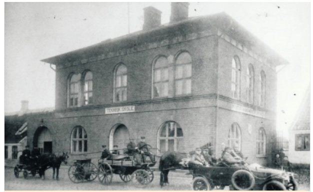
Den Tekniske Skole i Nykøbing cirka 1918.

Fredede bygninger er omfattet af en meget mere restriktiv administrationspraksis, der administreres af Slots- og Kulturstyrelsen.