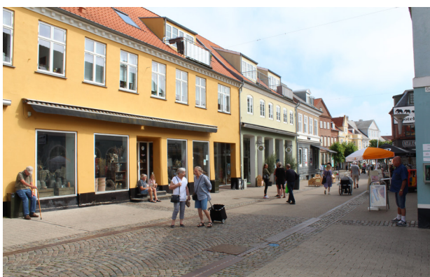
Mennesker tiltrækker mennesker, på Algade i Nykøbing.

Målsætning: At fremme en god dialog med bygherre om arkitektonisk kvalitet så tidligt som muligt i planprocessen