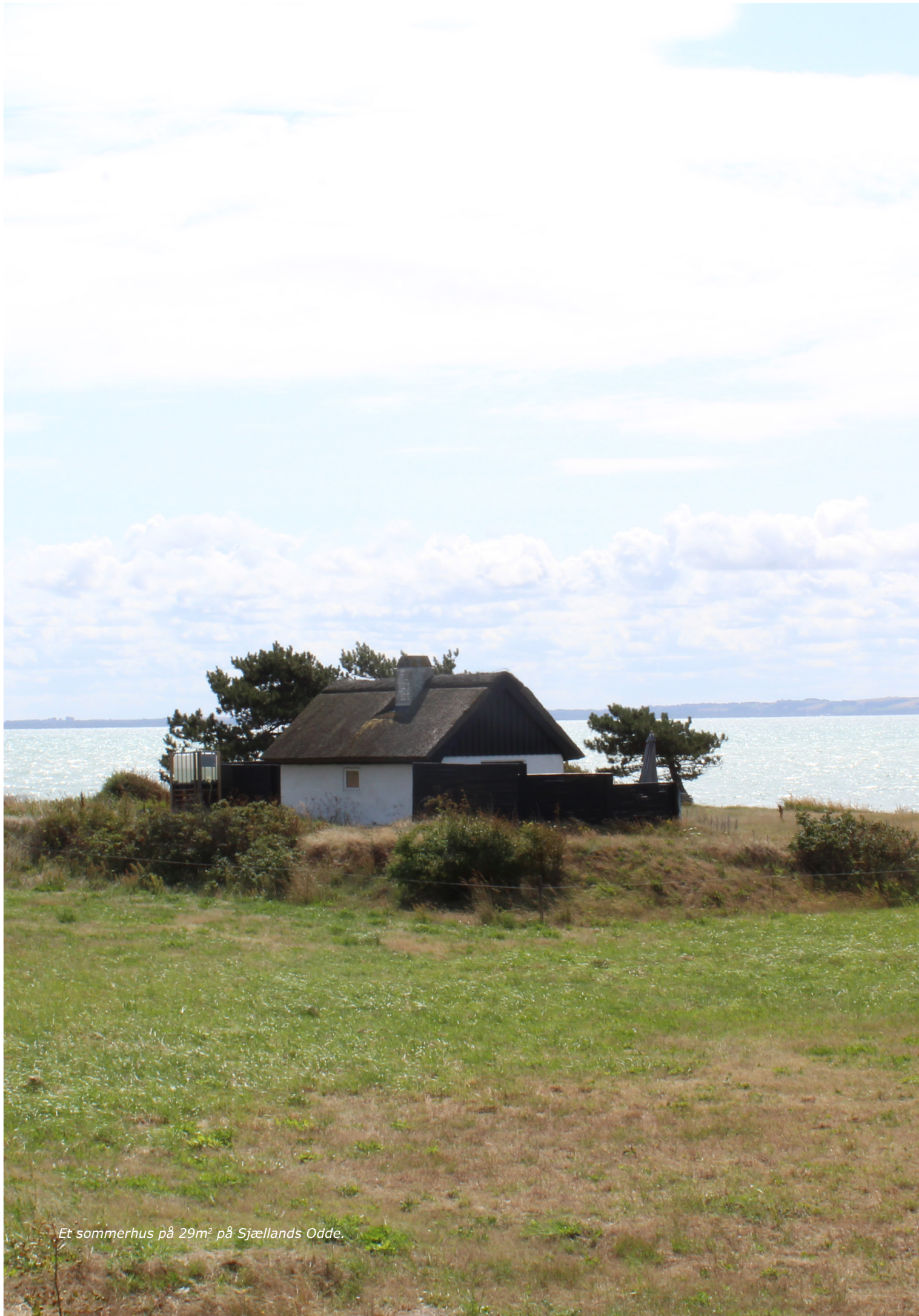
Et sommerhus på 29m 2 på Sjællands Odde.