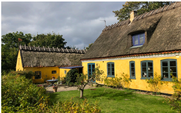
Et bevaringsværdigt længehus fra 1800 i Nakke, optaget i en bevarende lokalplan for Nakke landsby.