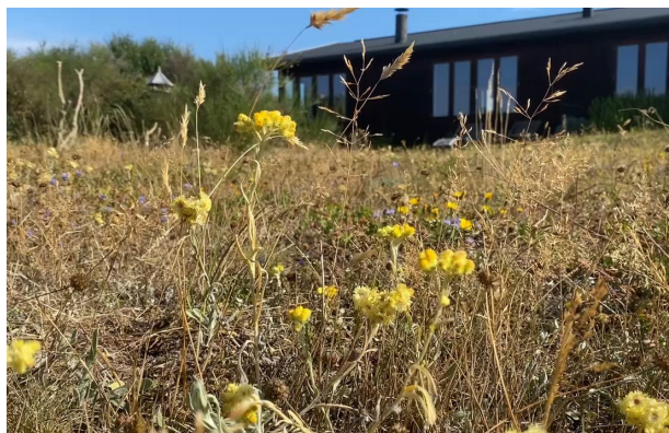
Biodiversitet på en sommerhusgrund.

En af de ting man kan gøre, er at begrænse den mængde fast belægning, man etablerer på grunden. En tæt belægningsgrad omkring en bygning, hindrer nedsivning og medfører derfor mere regnvand i kloaker mv.