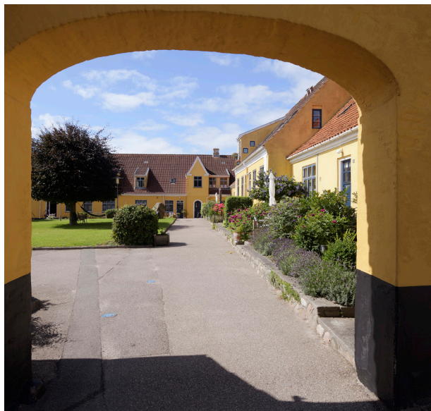
Den gamle bymidte i Nykøbing er ikke SAVE-registeret endnu.