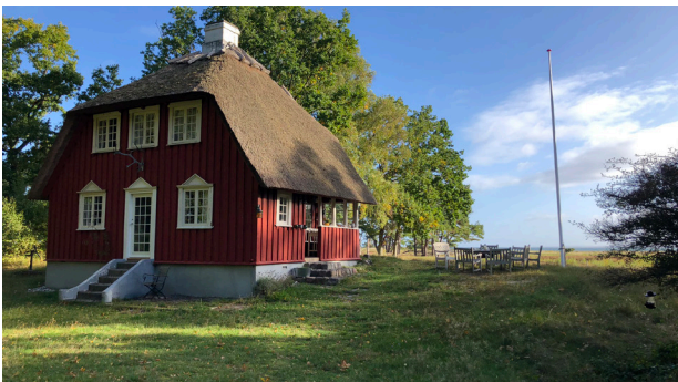
Jagthytte ved Rørvig fra 1918, tegnet af Poul Kofoed.