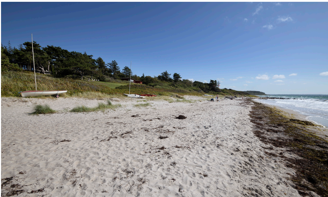
Ordrup strand mod Ordrup Næs.