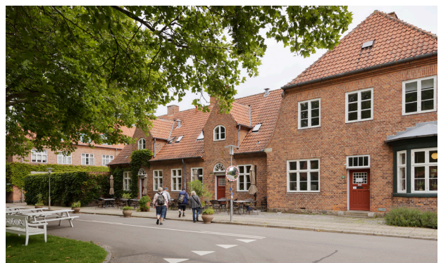
Annebergpark kulturmiljø, i bedre byggeskik stil. Bygninger indenfor området er bevaringsværdige eller fredede.