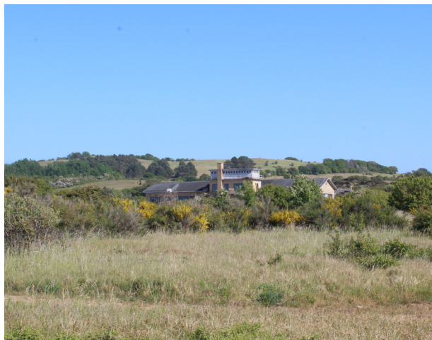
Skamlebæk radiostation nær Fårevejle opført i 1929, gemmer sig i landskabet.

Hvis du placerer et hus på tværs af et terræns naturlige højdekurver, vil huset hurtigt blive et fremmedelement. Hvis du derimod lader huset flugte med terrænets naturlige kurver, vil det oprindelige landskab være lettere at aflæse, og huset vil se mere naturligt ud.