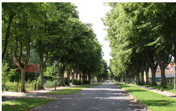
Lindeallé og Annebergparken i Nykøbing med karakteristisk beplantning.

i det åbne land, som både skaber markeringer af markernes afslutninger, og skaber gode levesteder og overgange for dyrelivet. Det skal vi passe på og underbygge i fremtiden.