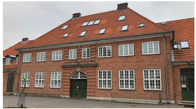
Grundtviggsskolen i Nykøbing opført cirka 1922 i Bedre Byggeskik stil, tegnet af Einar Andersen